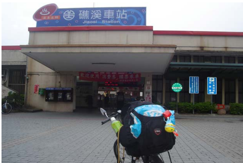
我終於從北宜公路下山，到達礁溪洗溫泉了