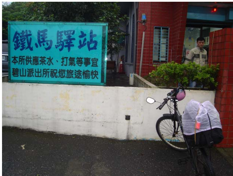
在這邊一定要補給水分