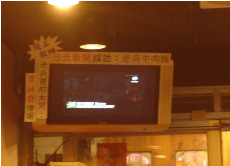
老兵牛肉麵熱心的幫女兒宣傳