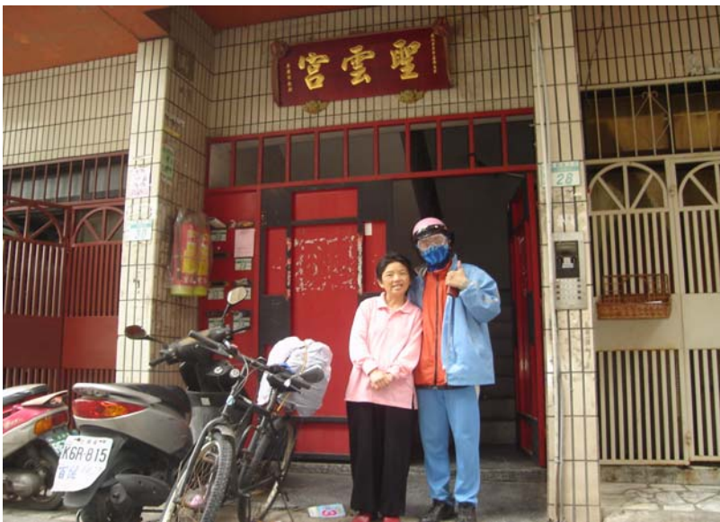
從樹林阿姨家出發