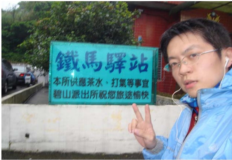
北宜公路上的碧山派出所，合影一張