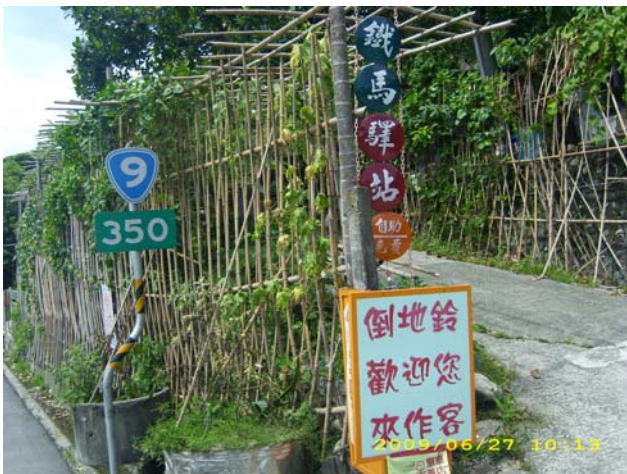
台東 鹿野 倒地鈴驛站 我喜歡這個驛站給我的家的感覺

在台東鹿野，晚上九點多苦於找不到住處的當下，遇到了許先生。倒地鈴，這是許先生在維持的驛站。提供路過的大家一個可以休息住宿的地方，而唯一要求只是希望大家待過這裡之後，可以更加認真的去體會家的感覺。把這個驛站當作自己的家，把恰巧路過的大家當作自己的家人，然後無拘無束的體會每個巧遇的家人。這或許也是我想追求的吧？總是希望將來可以找個地方，讓朋友、讓有需要的人待上一些日子，或許沒有共同經歷的回憶，卻珍惜當下每一刻。