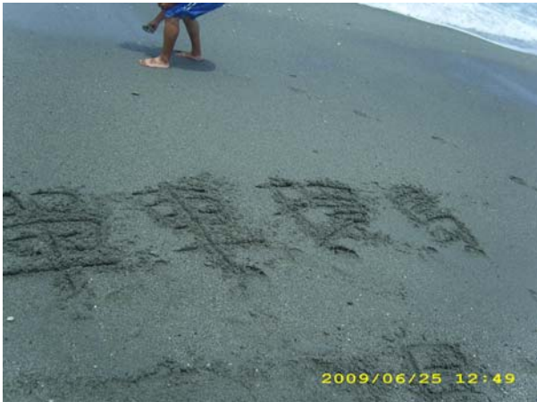
花蓮 七星潭 單車環島

在台東鹿野，晚上九點多苦於找不到住處的當下，遇到了許先生。倒地鈴，這是許先生在維持的驛站。提供路過的大家一個可以休息住宿的地方，而唯一要求只是希望大家待過這裡之後，可以更加認真的去體會家的感覺。把這個驛站當作自己的家，把恰巧路過的大家當作自己的家人，然後無拘無束的體會每個巧遇的家人。這或許也是我想追求的吧？總是希望將來可以找個地方，讓朋友、讓有需要的人待上一些日子，或許沒有共同經歷的回憶，卻珍惜當下每一刻。