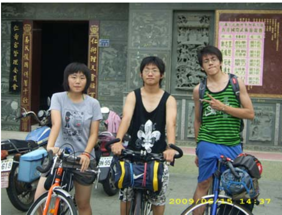
台南 歸仁 仁壽宮 出發前請友人拍的照片

找了一些網路上有關環島的心得，然後去捷安特詢問各種問題，以及訪查一些對台灣島比較瞭解的學長姐的體驗。各種資源都是我們不容錯過的，網路、店家、學長姐，甚至可能路過的親戚家，對我們這些高中剛畢業就打算要去環島的菜鳥而言無一不是可靠的資源，經濟的壓力亦壓的我們喘不過氣來。